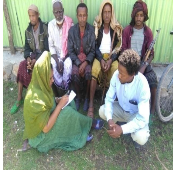
ከጭስ ተጠቃሚ ሴቶች ባሎች ጋር የተደረገ ቡድን ውይይት