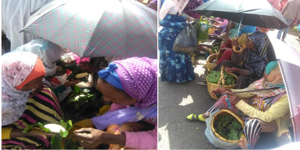
የለጋቅቤ ገበያ በኬሚሶ