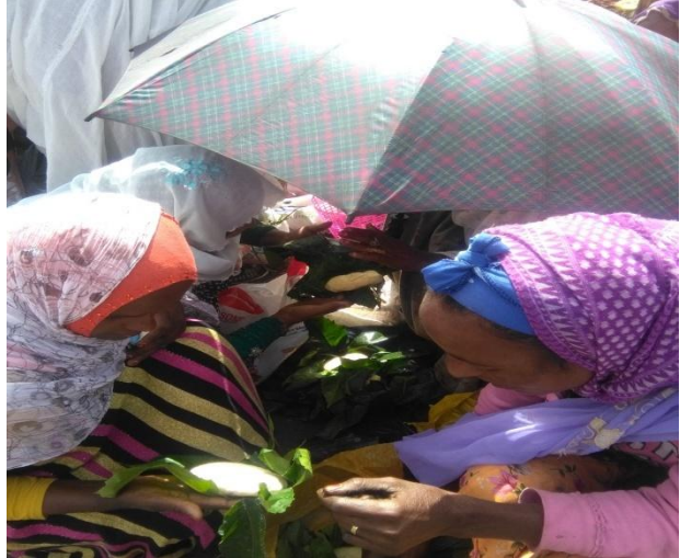
ፎቶ-6 የለጋ ቅቤ ማያዣ ጫጫ እና የለጋ ቅቤ ገበያ በኬሚሴ