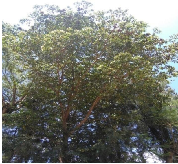
ፎቶ 3 የወይባ ዛፍ በወ/ሮ ፋጡማ ይማም ግቢ

እጾች እንደ ባህሪያቸው ከሃገረሰባዊ መድሃኒት መቀመጫ እስከ ተለያዩ ቁሶች መስሪያ አገልግሎት ላይ ይውላሉ ። በመሆኑም፣ በኬሚሴ ማህበረሰብ ወይባ እንጨት ዘርፈ ብዙ ተግባሮች ያሉት ተክል ነው። ከተግባራቶቹ ውስጥ ቀዳሚውን ቦታ የሚያዘው የተለያዩ ችግሮቻቸውን ለማቃለል ጭሱን ለእጥነት በመዋል በርካታ በሽታዎችን ፈውስ በመስጠትና ቀድሞ ለመከላከል ይጠቀሙበታል ። ቅጠሉንና ቅርፊቱን በማጨስ እርኩስ መንፈስን ለማራቅ ይረዳል በሚልም ይገለገሉበታል። በተጨማሪም፣ ወይባ ዛፍ እንደሌሎች እንጨቶች ሁሉ የቤት ውስጥ መገልገያ ቁሶችን ለመስራትም ያገለግላል። ለምሳሌ ያህል ግንዱን ለበር፣ ለሙቀጫና እጅ መሳሪያዎች መስሪያነት ያገለግላል ። እንጨቱ ከፍተኛ የሆነ እርጥበትን የመያዝ አቅም ያለው በመሆኑ አገልግሎቱም ይህንኑ ባህሪውን ተከትለው ለሚፈለጉ ተግባራት ይውላል።