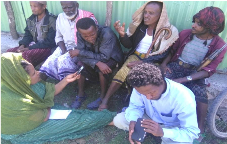
ፎቶ14 ከአድሜ ባለጸጋ አባቶችና ለጭስ ተጠቃሚ ሴት ባሎች ጋር የተደረገ የቡድን ውይይት (ፎቶ በአጥኝዋ)

ከታጠነች ሴት ጋር የተኛ እራሱ እንደታጠነ ነው። ካልጣጠነች ሴት ጋር የተኛ ጠዋት ችሎም አይነሳ። ህመም አያጣውም በእኛ ባህል ይህ ነው። አባዎራ የሚባለውም ቅቤና ወይባ የሚያሟላ ሲሆን ነው። ጠብ የሚመጣው ቅቤ አልገዛልኝም ወይባ አልፈለጠልኝም በሚል ነው። ልጅነት እንኳ ይዞት ችላ ቢል ጎጆ እስኪለዩ እናቱ ተከታትላ ታሟላለች በአማቶቹም ጥሩ ኑሮ ይዛለች የሚባለው በዚህ የሚያንከባክብ ባል ከሆነ ነው። ያ የሚቀናበት ቤት ይሆናል።