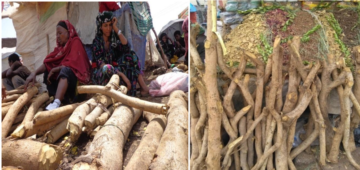
ፎቶ 2 የወይባ እንጨት ገበያ በኬሚሴ

ዋጋ ወጥቶላቸው ይሸጣሉ። በኬሚሴ ገበያ እንደ ደሴና ኮምቦልቻ ያሉ አጎራባች ከተሞች ወይባ እንጨት ለንግድ ጅምላ የሚገዙበት የገበያ ቦታ በመሆኑ ሰፊና የደመቀ የወይባ ተራ ያለው ነው።