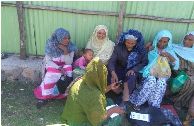
ከጭስ ተጠቃሚ ሴቶች ጋር የተደረገ ቡድን ውይይት