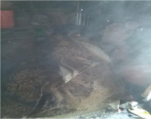
ፎቶ 7 ወር/ ፋጡማም ወይባ ጭስ በመሞቅ ፊቷን ስታስመታ ( ፎቶ በአጥኝዋ)

የወይባ ጭስ በሚሞቅበት ጊዜ የሚከውኑ የተለያዩ ስርአቶች አሉት። እነዚህም ከአመጋገብ እስከ አለባበስ ድረስ ለጭሱ ተብለው የተዘጋጁ ምግብና መጠጦችን በመጠቀም እና ለእጥነቱ ምቹ የሆነ አለባበስን በመከተል ይከወናል። በመሆኑም፣ የወይባ ጭስ ተጠቃሚ ሴት ወደ ጭስ መሞቅ ስትገባ እሳቱ ልቧን እንዳያደክመው እና በሚወጣት ላብ መተኪያ የሚሆን ትኩስ ምግብ መብላትና ትኩስ ነገሮችን መጠጣት ይጠበቅባታል። ምክንያቱም የምግቡ ትኩስነት ከምትሞቀው ጭስ ጋር ሲገናኝ በሰውነቷ ውስጥ የሚፈጠረው ሙቀት ከውጭ ከሚመታት የጭስ ሙቀት ጋር ይስማማል። የወይባ ጭስ የአሟሟቅ ሂደት የተፈለጠ የወይባ እንጨት ከተዘጋጀ በኋላ ጭስ የሌለው የእሳት ፍም በቦለቅያው ውስጥ በማስገባት የተፈለጠውን ወይባ እንጨት በመጨመር የምትሞቀው ሴት ከቦለቅያው ላይ ቁጭ ብላ ለጋ ቅቤ ከራስ ጸጉሯ እስከ እግር ጥፍሯ ድረስ ትለቀለቃለች። ከዚያም ከሌ ከአንገቷ በታች ትለብሳለች። ጭሱ እንዳይወጣ ከላይ ላይ ብርድ ልብስ ትደርብና ዙሪያዋን ተጠቅልላ ሰውነቷን በጭሱ ሙሉ ለሙሉ ታስመታለች። ከጭሱ ላይ እያለችም አጥሚት ወይም ሾርባ አጠገቧ ያለ አሟቂ እንዲያጠጣት ይደረጋል ። ጭሱ ፊቷን እንዲያገኛት ስትፈልግ ከአንገቷ ከፈት በማድረግ ወይንም ጎንበስ እያለች ፊቷን ወደ ሰውነቷ በማስገባት በጭሱ ትመታለች።