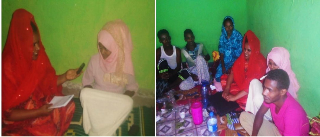
ፎቶ 9 ቃጩር ቀበሌ ከሙሽሪት አንሻ ጋር የተደረገ ቃለመጠይቅ

በዚህ ወቅት ከሚከወኑ ተግባራት አንዱ ሙሽሪት የወይባ ጭስ ለመጀመሪያ ጊዜ መሞቅ እንድትጀምር ማድረግ ነው። በማህበረሰቡ ባህልና ወግ መሰረት ልጃገረድ ወይባ እንዳትሞቅ በሁለት ምክንያቶች ክልከላ አለባት። አንደኛ ወይባ ሰውነት ስለሚያጠብቅ ልጃገረድ ወይባ ከሞቀች ሰውነቷ ይጠብቃል፤ ብልቷ ይጠነክራል፤ ከወንድ ጋር ግንኙነት ለማድረግ ያስቸግራል፤ የወንድ ብልት ወደ ውስጥ መግባት አይችልም ተብሎ እንደሚታመን መረጃ አቀባዩቸ ገልጸውልኛል ። ሁለተኛው የክልከላ ምክንያት የወይባ ጭስ ሽታ በጣም የሚስብና ለረጅም ጊዜ ከሰውነት ላይ የማይጠፋ፤ የሞቀችው ሴት ባለችበት አካባቢ ሁሉ ሽታው የሚማርክ በመሆኑ ወንዶችን በማማለል ያለዕድሜ ለሚደረግ ጾታዊ ግንኙነት ይዳርጋል ተብሎ ይታመናል። በመሆኑም ሴት ልጅ አግብታ የታዊ ግንኙነት ጀምራ ህገ እስከሚገሰስ ወይባ ጭስ መሞቅ አትጀምርም።