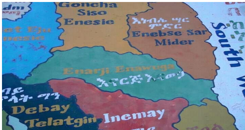
ስዕል1:- በምስራቅ ጎጃም ዞን የእናርጅ እናውጋ ወረዳን የሚያዋስኑት ወረዳዎች