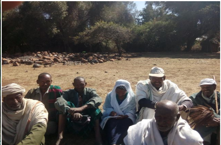
ስዕል3:- መረጃ ስብሰባዎ መረጃ በመስብሰብ ላይ። ስዕል4:- መረጃ ስብሰባዎ በቡድን ውይይት ላይ እያለች።