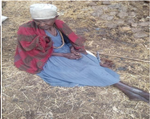
ስዕል1:- መረጃ ስብሰባዎ በአራራ ቀበሌ ከአጋኝ መረጃ ስብሰባዎ ጋር። ስዕል2:- የአራራ ቀበሌ ነዋሪ ህልም ፈቺ ይራብ አወቀ።