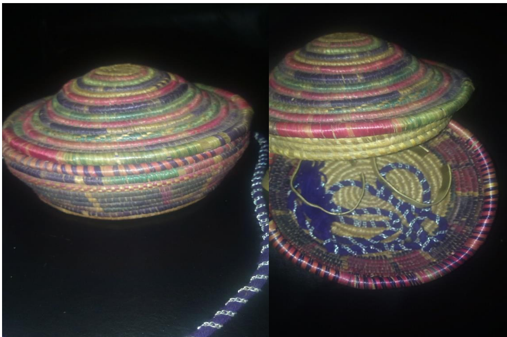
የእጅ አንባር እና ክታብ የያዘ ሙዳይ ሙሽሪት ከእናቷ የሚሰጧት ስጦታዎችን የሚያሳይ 08/08/2013 ዓ.ም