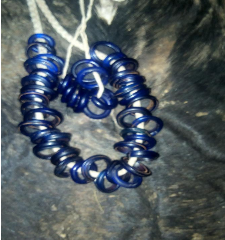
ማርዳ 01/08/2013ዓ.ም