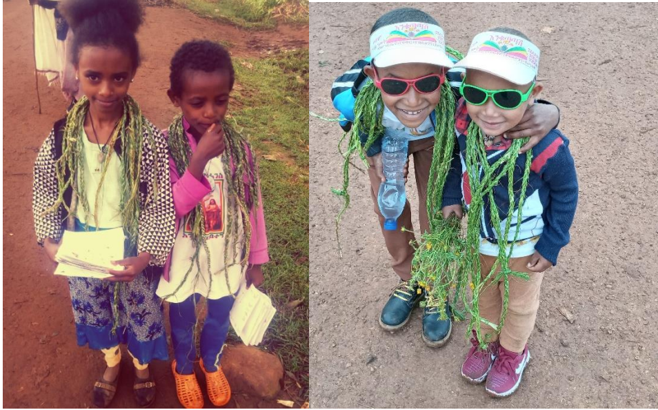
ፎቶ፡ ህጻናት ለአዲስ ዓመት እንግጫ ጉንጉን ይዘው የሚያሳይ 01/01/2013 ዓ.ም፣ ደ/ኤልያስ