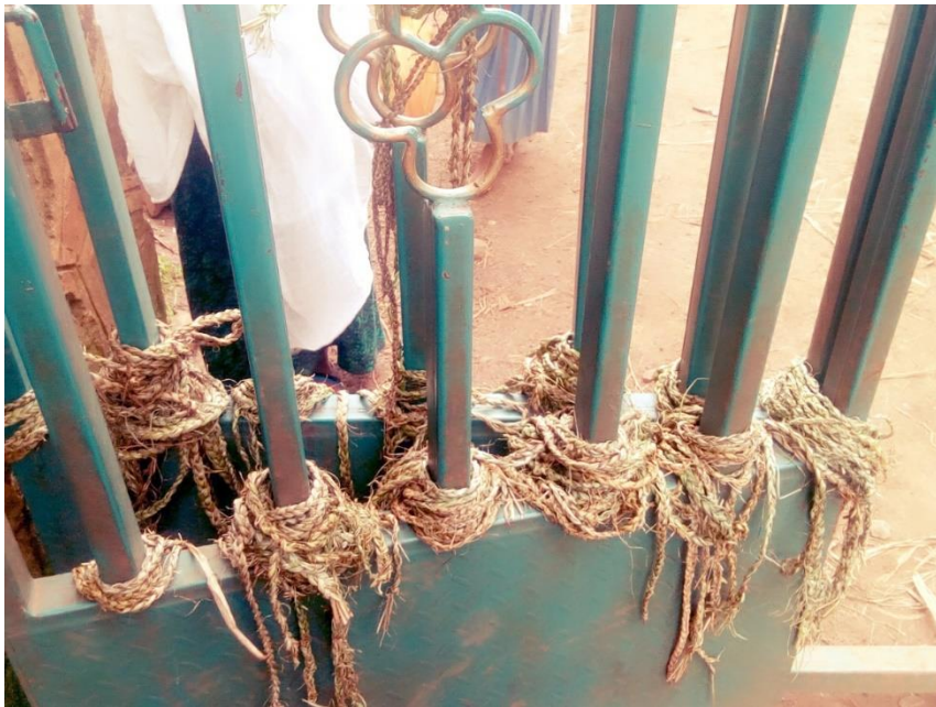
ለቤተክርስቲያን የእንግጫ ስጦታ 02/01/2013 ዓ.ም፣ ደ/ኤልያስ