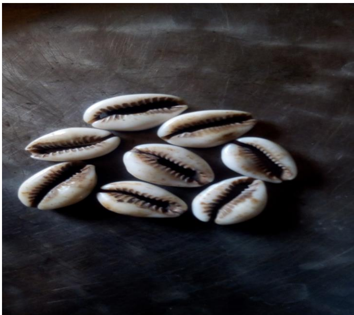
ፎቶ በአጥኝዎ፡ ጫጫቱ 01/08/2013ዓ.ም