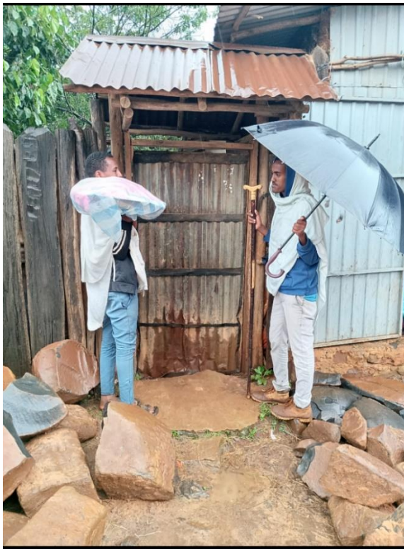
የቡሄ ዳቦ ለክርስትና ልጅ ይዘው ሲገቡ የተነሳ ነሃሴ13/2013ዓ.ም፣ ደ/ኤልያስ