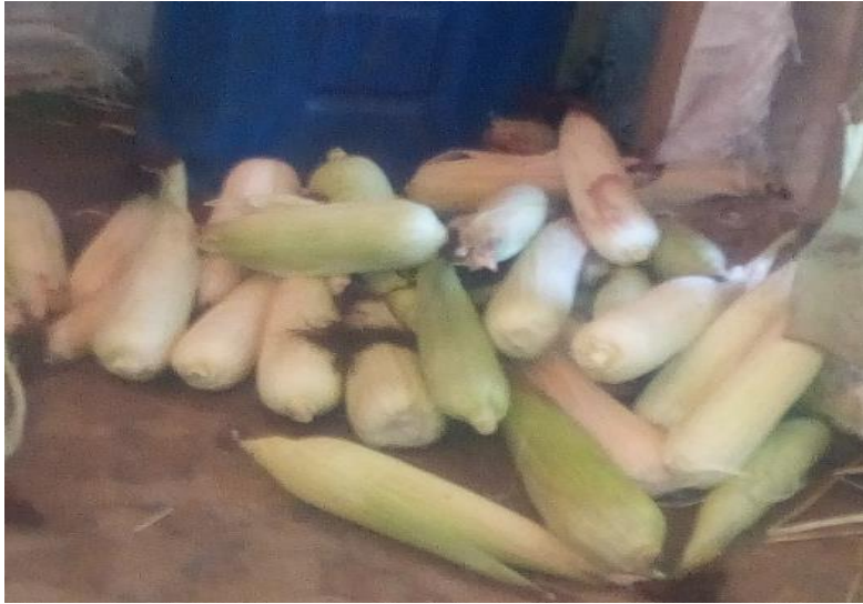
ዘመዳችን ከገጠር ያመጡልን የበቆሎ እሸት ስጦታ ሐሙስ ጥቅምት 26/2013ዓ.ም፣ ደ/ኤልያስ