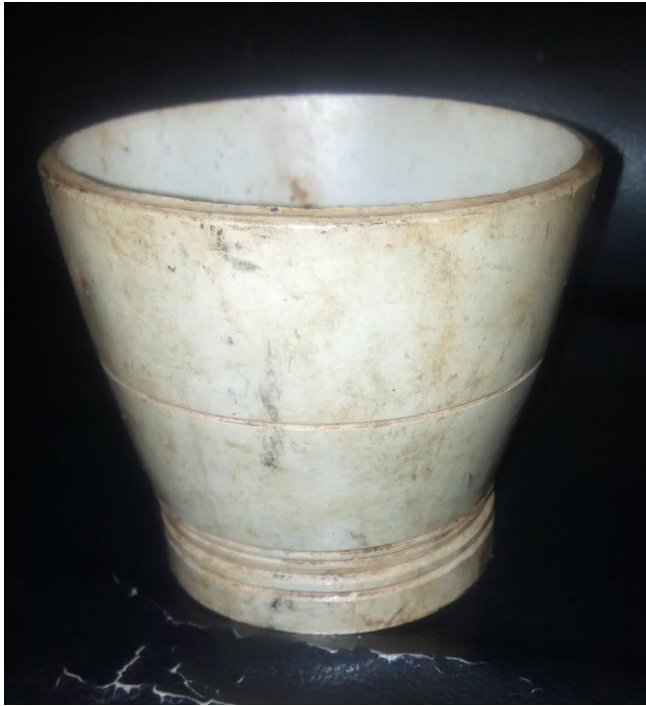
ለሙሽሪት የሚሰጥ የሙሽሪ ዋንጫ 08/08/2013ዓ.ም