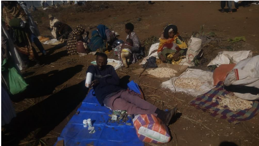
ለድሆች የተሰጠ የእህል ስጦታ 01/04/2013 ዓ.ም፣ ደ/ኤልያስ